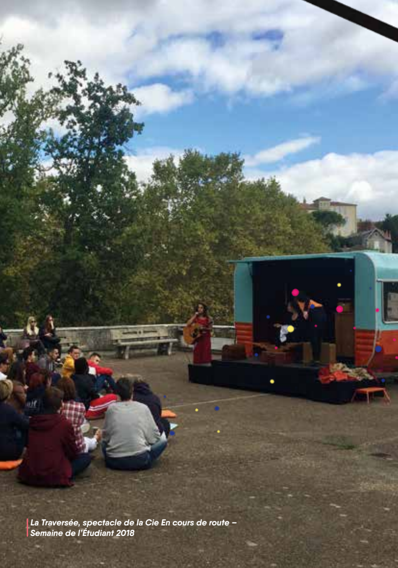
La Traversée, spectacle de la Cie En cours de route – Semaine de l'Étudiant 2018