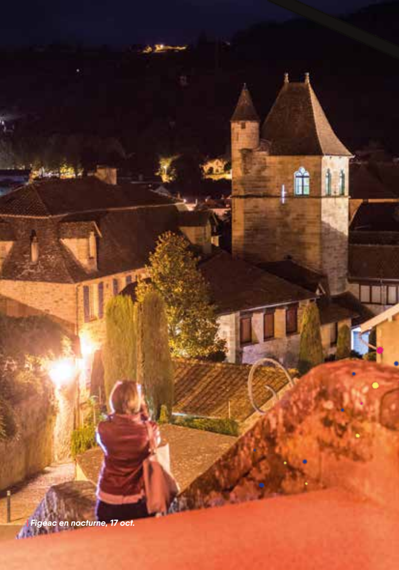
Figéac en nocturne, 17 oct.